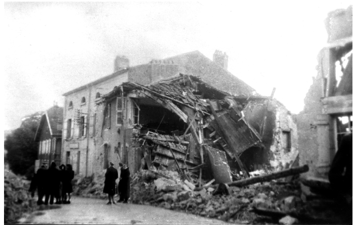
Arnville - septembre 44 - Grande rue - la maison Collignon après sa destruction par les Allemands