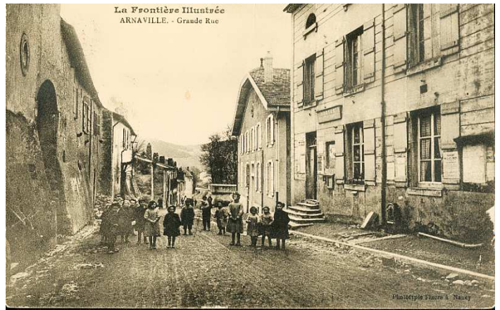
Grande Rue avant destruction