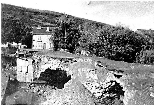
Pont sur le Rupt de Mad