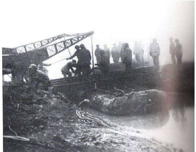
Mise en place d'un pont (photos US)

Evacuation de M f THIEBAUT vers BAYONVILLE