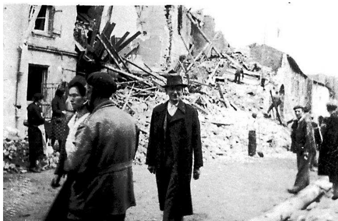
Grande Rue , maisons qui fermaient l'âtre. (Collection Quack)