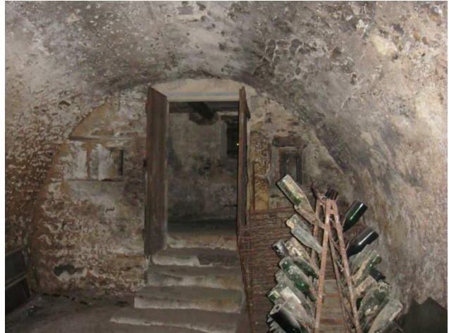
5 caves où se sont réfugiées 5 familles URY, DUPONT, WILLAUME, CANUT,(COURTIOL)