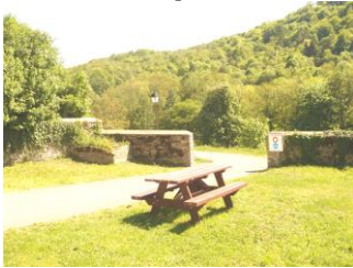
Chemin Piétonnier (2002)