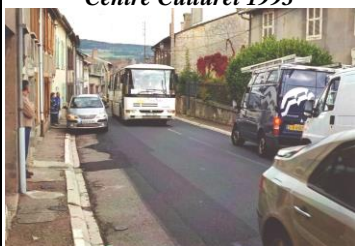
Traverse village avant 2009