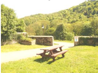
Chemin Piétonnier (2002)