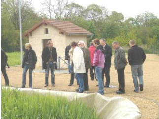
Station d'épuration (2007)