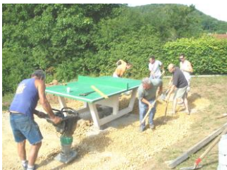
Mise en place de la table de ping pong (2009) aire de jeux et terrain de basket (2013/2014)