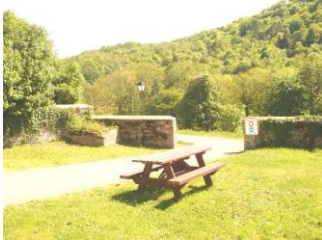
Chemin Piétonnier (2002)