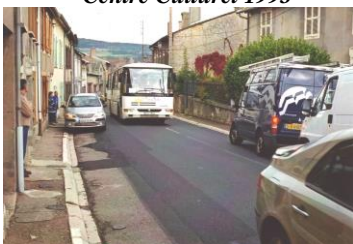
Traverse village avant 2009