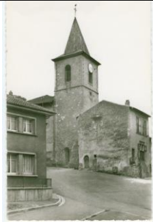
Place de l'Eglise (carte ancienne)