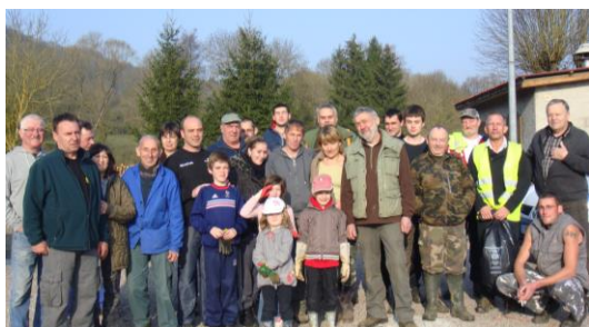
Nettoyage de Printemps

Siégeant au niveau du Centre Communal d'Action Sociale (CCAS) il était de toutes les missions : distribution de la Banque Alimentaire, vente des Brioches de l'Amitié et surtout organisation du Repas des Anciens où on le voyait avec son tire-bouchon parcourir la salle pour que personne ne manque de rien... un petit mot pour chacun au passage.