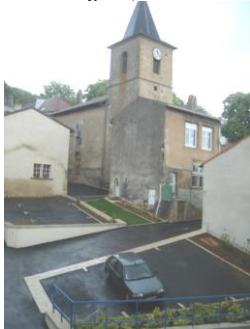
Place de l'Eglise 2009