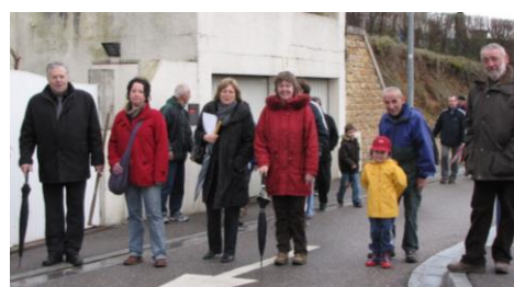
Marche des Passeurs

Sa connaissance des habitants des villages voisins, Novéant, Bayonville, Vilcey sur Mad, Pagny, permettait de trouver des solutions, pour les uns et pour les autres, en cas de besoin matériel ou humain.