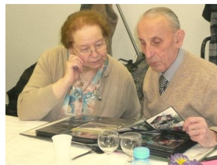
... et par ses amis de l'Association des Fêtes