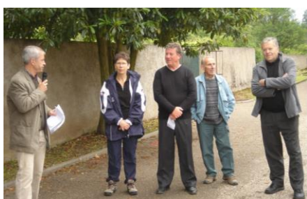
Inauguration du sentier des aîtres

Très investi au niveau des associations du village, il a beaucoup œuvré dans la création et la pérennisation de l'Association des Fêtes où il était élu Vice-Président. Aucun matériel n'avait de secret pour lui, il gérait les stocks comme s'il s'agissait d'un bien personnel. Il anticipait chaque manifestation pour que jamais rien n'y fasse défaut. Il rendait les lieux, intérieur comme extérieur, tels qu'il les avait trouvés. Chacun savait compter sur lui.... Peut-être un peu trop... on s'habitue vite à ce genre de chose.