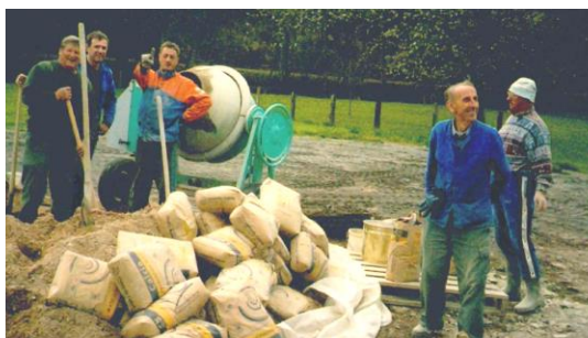
Construction de la buvette Place des Fêtes

Très investi au niveau des associations du village, il a beaucoup œuvré dans la création et la pérennisation de l'Association des Fêtes où il était élu Vice-Président. Aucun matériel n'avait de secret pour lui, il gérait les stocks comme s'il s'agissait d'un bien personnel. Il anticipait chaque manifestation pour que jamais rien n'y fasse défaut. Il rendait les lieux, intérieur comme extérieur, tels qu'il les avait trouvés. Chacun savait compter sur lui.... Peut-être un peu trop... on s'habitue vite à ce genre de chose.