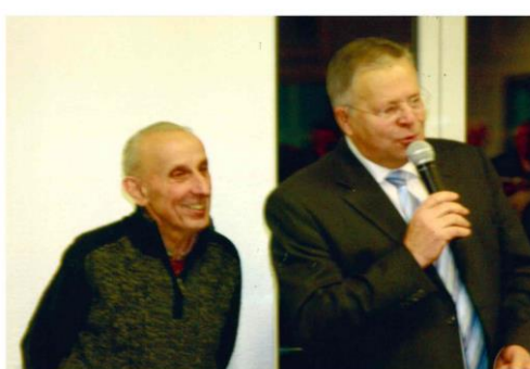
80 printemps fêtés en janvier 2013 aux vœux du Maire en présence de la population